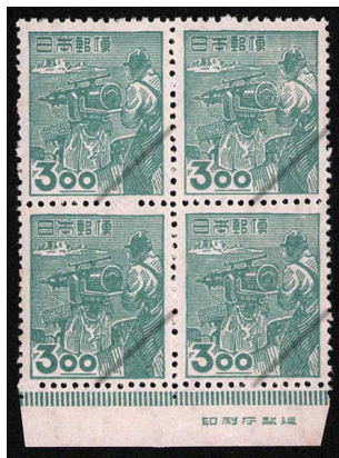
HH5-05 産業図案3円 田型 NH ⑩銘版 未使用 265 ¥5,500