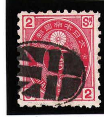
HH4-18 U小判2銭 大ボタ赤間関 使用済 65 ¥2,200