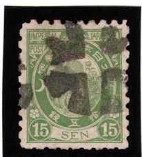
HH3-22 旧小判15銭 外郵クロスロード 白紙8% 少々 使用済 58 ¥5,500