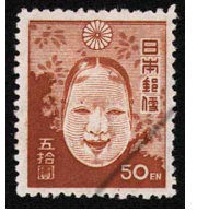
HH7-03 第2次新昭和 50円 OH 未使用 262 ¥6,600