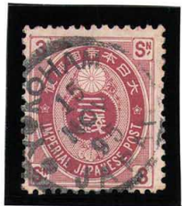
HH4-08 新小判3銭 ◎YOKOMAMA/15 NOV 95 JAPAN 使用済 66 ¥2,200