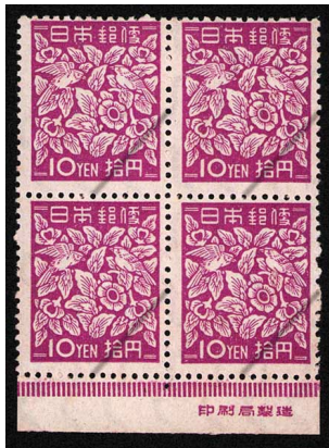
HH5-03 第2次新昭和凸10円 田型 NH ⑩銘版 輪・全 未使用 261 ¥16,500