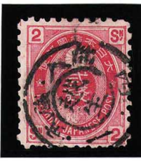
HH4-11 U小判2銭 ◎越生KG 武蔵 使用済 65 ¥3,300