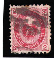
HH4-14 U小判2銭 大ボタ長崎 正N 目打少乱 使用済 65 ¥3,300