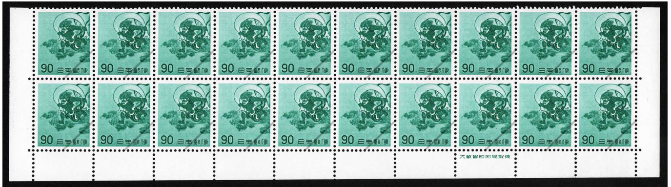
HH8-01 第2次円単位90円 20枚群 NH ⑬銘版 未使用 321 ¥27,500