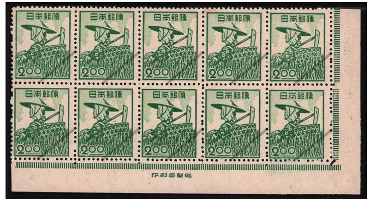
HH5-04 産業図案2円 10枚群 NH ⑩銘版 未使用 264 ¥3,300