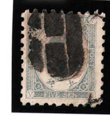
HH4-30 U小判5銭 大ボタ函館 使用済 68 ¥3,300