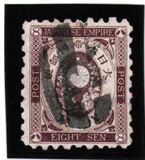
HH3-17 旧小判8銭 大ボタ札幌 白紙9 使用済 55 ¥5,500