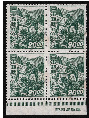
HH6-04 産業図案20円 田型 NH ⑩銘版 糊微々 未使用 272 ¥9,900