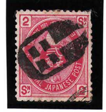
HH4-25 U小判2銭 大ボタ甲府 使用済 65 ¥4,400