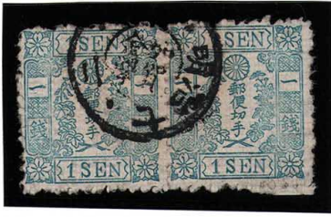
HH2-01 和桜青1銭11版20・21番 横連