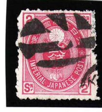
HH4-29 U小判2銭 大ボタ札幌 目打難 使用済 65 ¥5,500