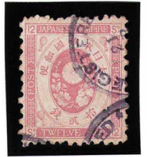
HH3-21 旧小判12銭 E紙11×10 ○(REGISTERED YOKOHAMA) 紫印 使用済 57 ¥16,500