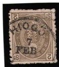
HH3-04 旧小判才2銭 閉裂 OHIOGO 7 FEB 無地11s 使用済 49 ¥3,300