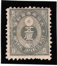
HH3-01 旧小判5厘 OH 藁11L 糊少乱 未使用 46 ¥3,300