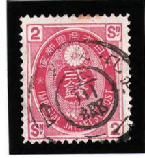
HH4-12 U小判2銭 ◎玉川郷KG 武蔵 使用済 65 ¥3,300