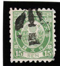
HH3-23 旧小判15銭 RC 小型外郵上海白抜(サ) 白紙9 使用済 58 ¥5,500