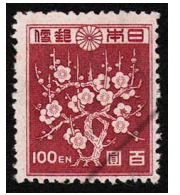
HH7-06 第2次新昭和 100円 NH 未使用 263 ¥8,800