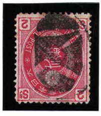
HH4-26 U小判2銭 大ボタ前橋 ウルス少難 使用済 65 ¥3,300