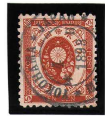
HH4-09 新小判10銭 ◎MEIJI:YOKOHAMA/4 IV 1893 使用済 70 ¥2,200