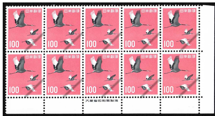
HH8-02 第2次円単位100円 10枚群 NH ⑬銘版 未使用 322 ¥11,000