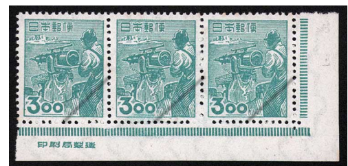
HH5-06 産業図案3円 3枚横連 OH ⑩銘版 糊微々 未使用 265 ¥3,300