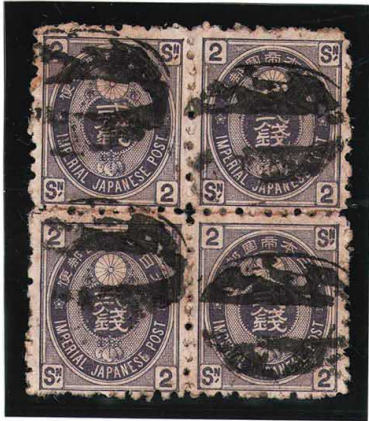
HH3-06 旧小判紫2銭 大ボタ京都 無地10 使用済 50 ¥11,000