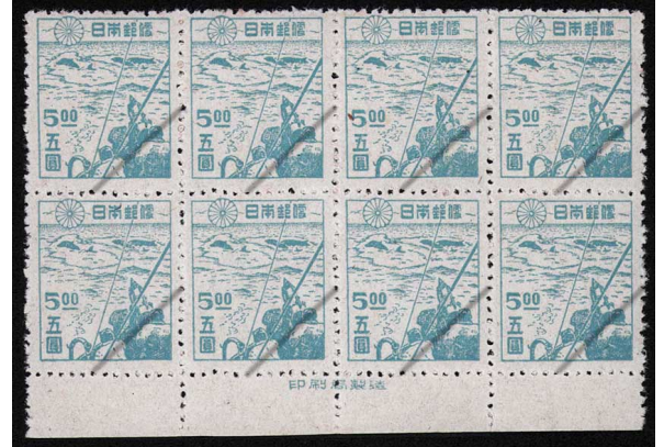
HH5-02 第2次新昭和5円 8枚群 OH ⑩銘版 白耳13×13½ 下抜 未使用 259 ¥9,900