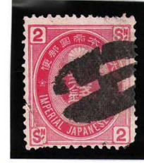
HH4-28 U小判2銭 大ボタ鳥取 RC 閉裂 使用済 65 ¥3,300