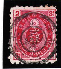
HH4-13 U小判2銭 ◎粕壁KB 2 武蔵 使用済 65 ¥3,300