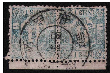
HH1-06 和桜青1銭7版33・34番 横連 ◎甲州/甲府郵便役所 後期印刷 33番右上PH 使用済 10g ¥88,000