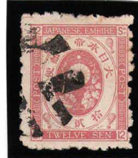
HH3-20 旧小判12銭 外郵クロスロード E紙11×10 使用済 57 ¥16,500