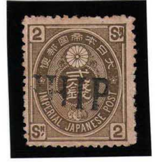
HH3-05 旧小判才2銭 SHIP 無地12% 使用済 49 ¥5,500