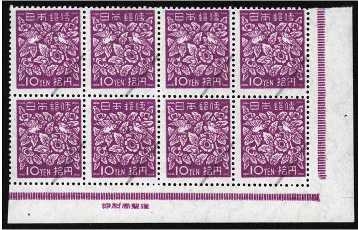
HH7-01 第2次新昭和凸10円 8枚群 OH ⑩銘版 未使用 261 ¥13,200