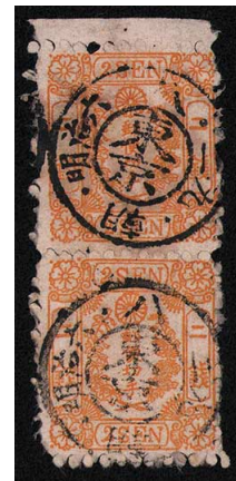
HH1-04 和桜黄2銭13版3・11番 縦連 ◎東京N.Bi/6.8.29.朝 使用済 12c ¥16,500