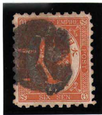
HH4-03 旧小判6銭 外郵シフ付Y E紙10 使用済 54 ¥16,500