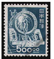
HH7-11 産業図案500円 NH 糊極微シ 未使用 274 ¥29,700