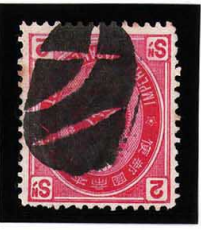
HH4-16 U小判2銭 大ボタ長野 使用済 65 ¥3,300