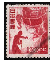
HH7-10 産業図案100円 OH 未使用 274 ¥33,000