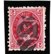
HH4-20 U小判2銭 大ボタ高田 少補修 使用済 65 ¥3,300