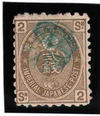
HH3-03 旧小判才2銭 外郵小型8花緑印 無地10 使用済 49 ¥5,500