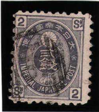
HH3-07 旧小判紫2銭 B62 木綿10 使用済 50 ¥5,500