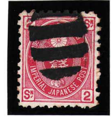
HH4-15 U小判2銭 大ボタ鹿児島 使用済 65 ¥2,200