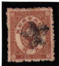
HH3-13 旧小判5銭 微々 外郵函館★印 無地10s×11s 使用済 53 ¥11,000