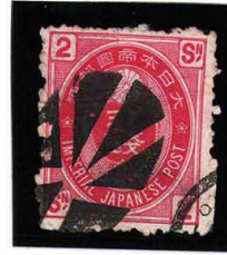
HH4-23 U小判2銭 大ボタ水戸 裏紙残 少シ 使用済 65 ¥3,300