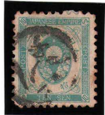
HH3-19 旧小判10銭 記番シ28号 無地10 使用済 56 ¥3,300