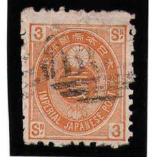
HH3-09 旧小判3銭 B62 木綿10 使用済 51 ¥3,300