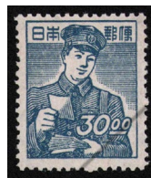
HH7-08 産業図案30円 OH 未使用 273 ¥3,300