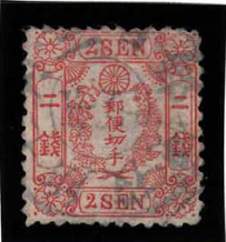
HH2-08 和桜赤2銭 政府