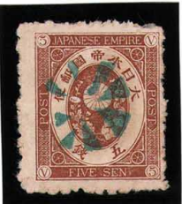
HH3-12 旧小判5銭 外郵小型8花緑印 無地11s 使用済 53 ¥5,500