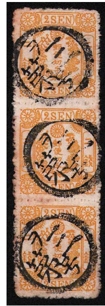
HH1-02 房桜黄2銭 縦3連 記番ヲ3号 (尾張名古屋) 使用済 44 ¥5,500