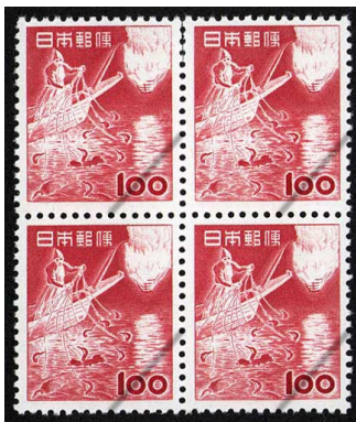
HH7-07 第1次円単位100円 田型 NH 未使用 310 ¥13,200