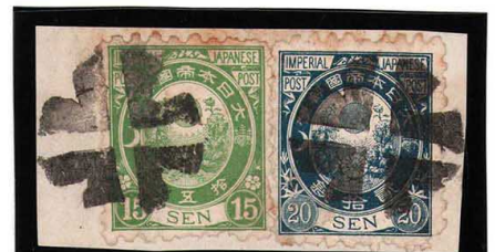
HH3-25 旧小判15・20銭 外郵クロスロード 白紙8% 2枚貼付ピース 使用済 58・59 ¥11,000