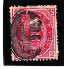
HH4-22 U小判2銭 大ボタ広島 使用済 65 ¥2,200