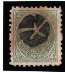
HH3-10 旧小判4銭 小ボタ大津 無地10 使用済 52 ¥11,000