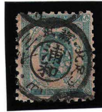
HH4-04 旧小判10銭 ◎浦和KG 武蔵 無地10 使用済 56 ¥3,300