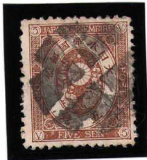
HH4-02 旧小判5銭 外郵クロスロード 無地12% 使用済 53 ¥3,300