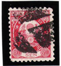
HH4-07 旧小判50銭 外郵Y 白紙10 使用済 62 ¥3,300