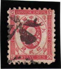
HH4-06 旧小判12銭 白紙10 ◎外郵4枚プロハラ 裏小印 使用済 57 ¥13,200