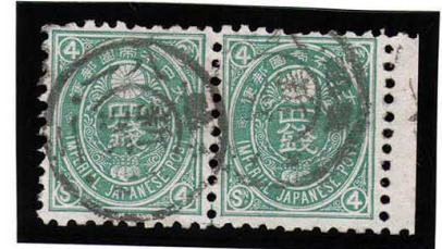
HH3-11 旧小判4銭 ◎新潟KG 越後 薄紙10 使用済 52 ¥5,500