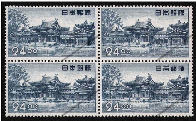
HH7-04 昭和すかしなし24円 田型 NH 未使用 289 ¥11,000