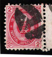
HH4-17 U小判2銭 大ボタ松江 使用済 65 ¥3,300