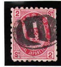
HH4-24 U小判2銭 大ボタ横須賀 使用済 65 ¥4,400