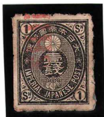
HH3-02 旧小判黒1銭 SHIP 朱印 無地10s 小紙残 使用済 47 ¥5,500