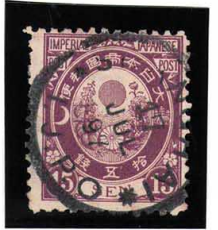
HH4-10 新小判15銭 ◎SHANGHAI/17 JUL 97 IJPO 使用済 71 ¥3,300