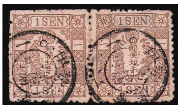
HH1-05 房桜茶1銭 横連 ◎宇治浦田町KG伊勢 使用済 43 ¥5,500