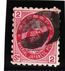
HH4-19 U小判2銭 大ボタ山形 使用済 65 ¥2,200