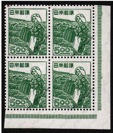
HH6-01 産業図案茶摘み 5円 田型 NH P 微々 未使用 267 ¥11,000