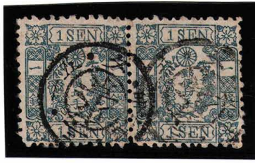
HH2-02 和桜青1銭26版35・36番 横連