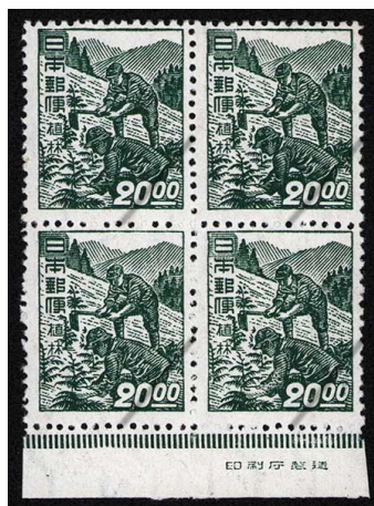
HH6-05 産業図案20円 田型 NH ⑩銘版 未使用 272 ¥19,800