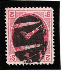
HH4-21 U小判2銭 大ボタ松山 使用済 65 ¥3,300