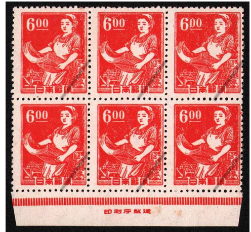
HH6-02 産業図案6円 6枚群 NH ⑩銘版 微々 未使用 268 ¥3,300