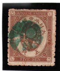
HH3-14 旧小判5銭 外郵小型8花緑印 E紙11s×9s 使用済 53 ¥5,500