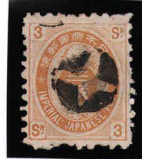
HH3-08 旧小判3銭 白抜十字 薄紙10 使用済 51 ¥5,500