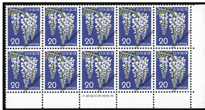
HH8-03 第1次ローマ字入り旧藤20円 10枚群 NH ⑬銘版 未使用 328 ¥2,200