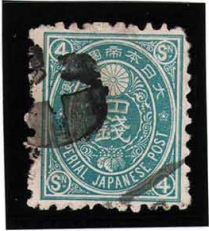
HH4-01 旧小判鮮青4銭 白抜十字 E紙10 使用済 52 ¥4,400