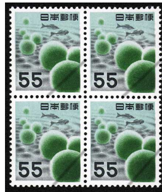
HH7-05 第1次円単位55円 田型 NH 未使用 308 ¥4,400