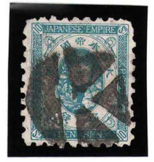
HH4-05 旧小判10銭 外郵K 使用済 56 ¥2,200