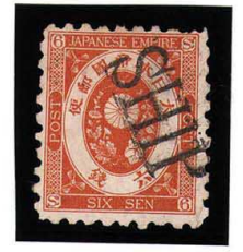
HH3-16 旧小判6銭 SHIP 白紙9 少々 使用済 54 ¥16,500