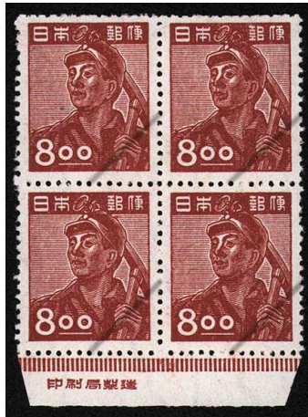
HH6-03 産業図案8円 田型 NH ⑩銘版 未使用 269 ¥5,500