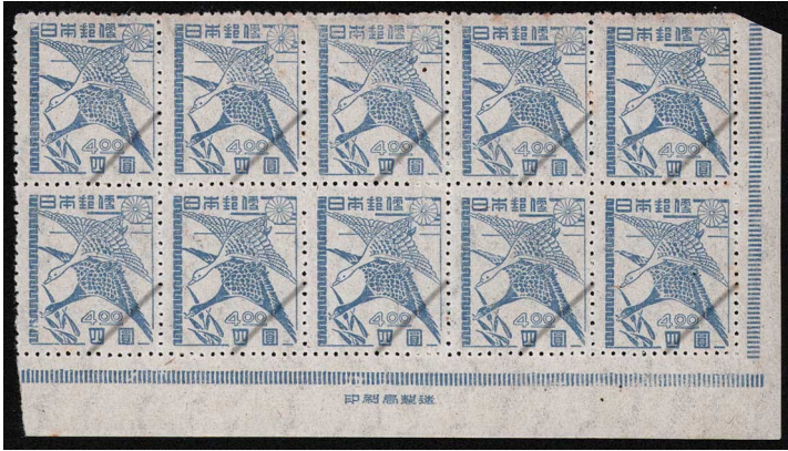
HH5-01 第2次新昭和4円 10枚群 NH ⑩銘版 未使用 258 ¥6,600