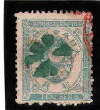
HH3-18 旧小判10銭 外郵小型8花緑印 無地12% 使用済 56 ¥3,300