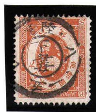
HH3-15 旧小判6銭 ◎下妻KG 常陸 P13 使用済 54 ¥16,500