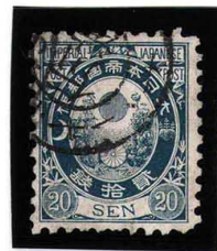
HH3-24 旧小判20銭 ◎仁川港 JN 白紙10 使用済 59 ¥16,500