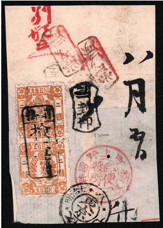
HH1-01 洋桜黄2銭「ハ」 縦連 日前橋/検査済 ◎上野國群馬郡前橋/郵便役所 オビース 使用済 25c ¥11,000