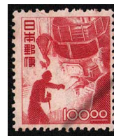
HH7-09 産業図案100円 NH 糊少シ 未使用 274 ¥27,500