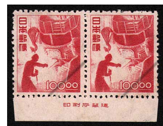
HH6-06 産業図案100円 横連 NH ⑩銘版 耳糊少汚 未使用 274 ¥165,000