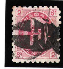
HH4-27 U小判2銭 大ボタ宇都宮 使用済 65 ¥5,500