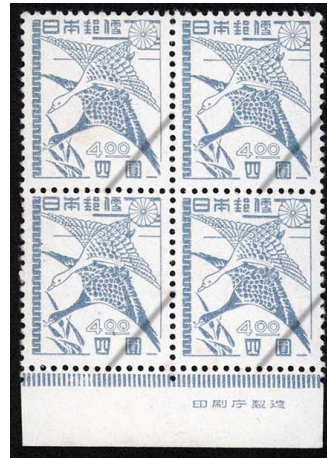
HH7-02 昭和すかしなし4円 田型 NH ⑫銘版 糊少シ 未使用 281 ¥5,500