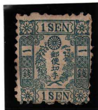
DDO-08 和桜青1銭3版28番 中間印刷 P10 縞 OG OH 未使用 10v ¥275,000