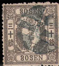
DD5-23 洋桜灰30銭「イ」 外郵青色複十字 (YH75D) 使用済 30 ¥11,000