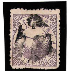
DDO-14 鳥紫15銭「ロ」 書き十字 外郵Y 上P1 補修 使用済 32b ¥682,000