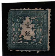
DDO-07 龍老銭1版39番 縞 OH 微破あり 未使用 6a ¥154,000