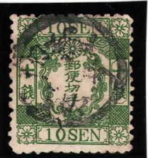
DD5-22 洋桜緑10銭「ロ」 記番イカ壹号 裏小印 使用済 28b ¥11,000