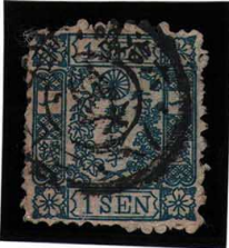
DD5-06 和桜青1銭7版26番 ◎大阪/6.8.27. 午前 無地 使用済 10f ¥16,500