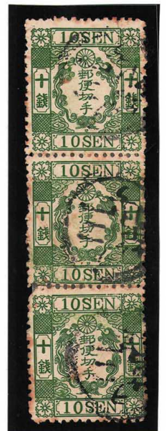
DD3-13 洋桜緑 10「ロ」 2-18 番 記番ヲ 3 号(名古屋) 18 番背棘落エラー 使用済 28b ¥110,000