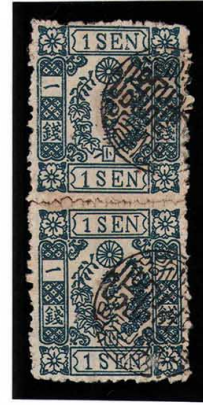
DD3-04 洋桜青 1 銭「ト」 篆書不統一印(三河棚尾) 再接 使用済 24g ¥22,000