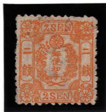
DDO-11 和桜黄2銭I 7-aS 飾枠2落・菊葉軽彫エラー OH 未使用 12c ¥66,000