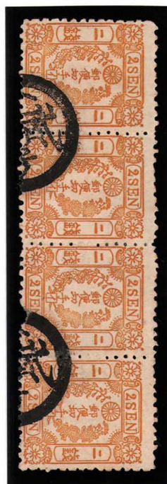
DD3-11 洋桜黄 2 銭「イ」 記番イへ 2 号 (播磨明石) 使用済 25a ¥44,000