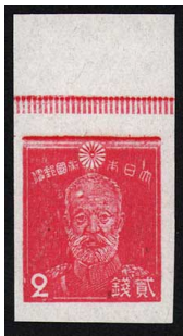
DD8-04 第3次昭和乃木2銭 台切手上辺ムラ印刷 未使用 222 ¥3,300