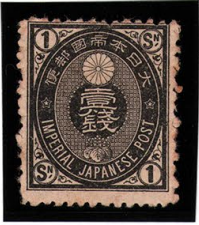
DD6-01 旧小判黒1銭 OH 無地12% 未使用 47 ¥8,800