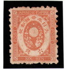
DD6-05 旧小判6銭 NG E紙10 P少シ 未使用 54 ¥8,800