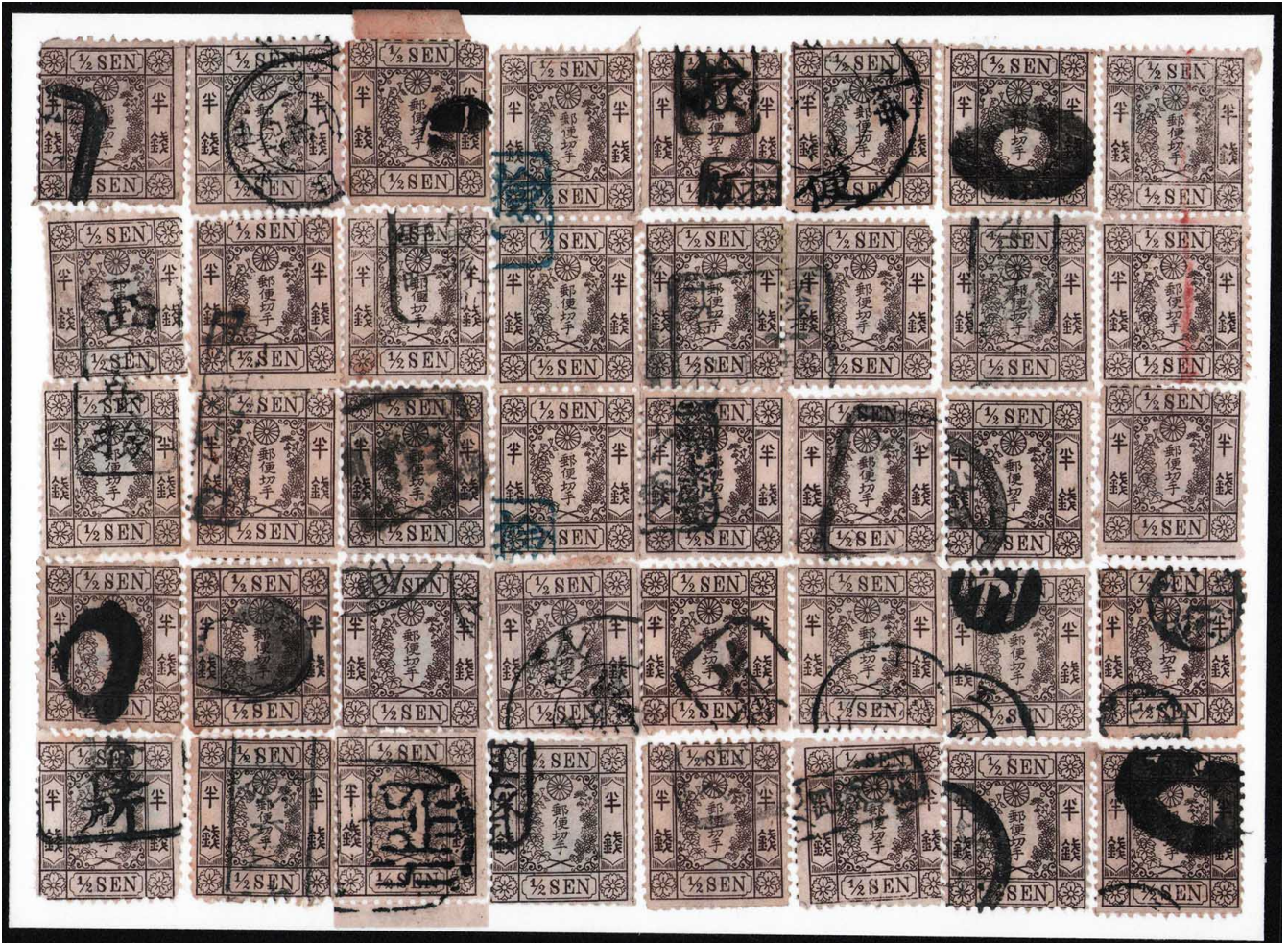
DD2-01 和桜茶半銭1版 使用済みコンストラクション ¥88,000