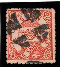
DD5-28 洋改桜橙6銭「ル」 外郵白抜十字 (HG79A) 使用済 37b ¥5,500