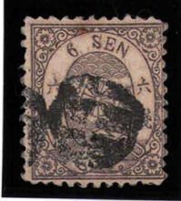
DD5-13 和桜墨6銭「チ」40番 白抜記番子一 左上PH 縞 使用済 18h ¥44,000