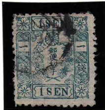
DD5-07 和桜青1銭2版16番 ◎大阪N 1 B 1 政府 縞 使用済 10g ¥27,500