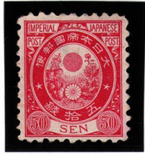
DD6-08 旧小判50銭 NG 薄紙10 微カス 未使用 62 ¥11,000