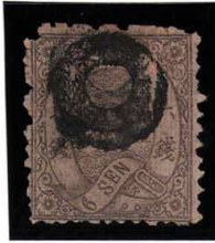
DD5-12 和桜墨6銭「ホ」16番 小ボタ大阪 蔓葉2落エラー 使用済 18e ¥55,000