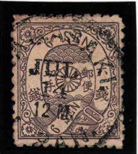
DD5-21 洋桜墨6銭「タ」 ○NAGASAKI/JUL 14 12M JAPAN 使用済 27f ¥22,000