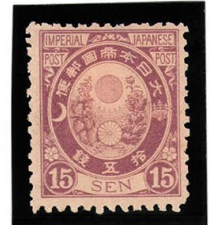
DD6-13 新小判15銭 OH P12 未使用 71 ¥8,800