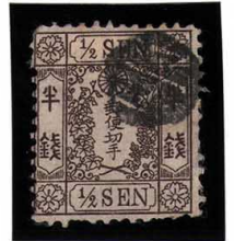
DD5-05 和桜茶半銭4版40番 白抜記番子一 松田 無地 使用済 9d ¥5,500