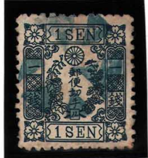
DD5-17 洋桜青1銭「ル」 外郵6花青印(YH75E) 使用済 24k ¥22,000