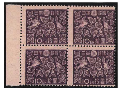
DD7-10 第2次新昭和凹10円 NH 縦目打ずれ 未使用 260 ¥8,800