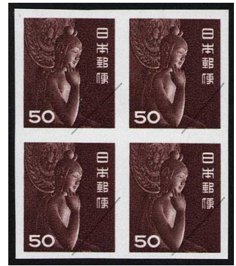
DD8-03 第1次円単位50円田型 NH 無目打エラー 未使用 307 ¥385,000