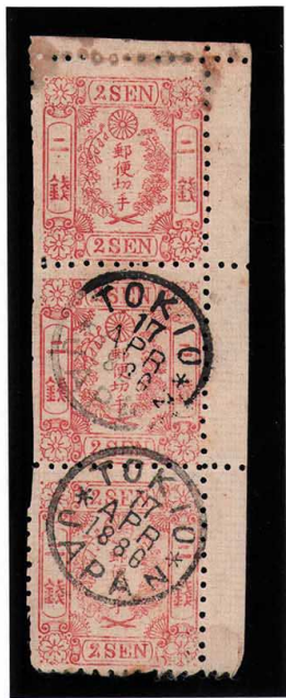
DDO-04 和桜赤2銭2版8-24番 リムダ-20シ TOKIO/17APR1886 使用済 11b ¥132,000