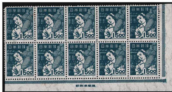
DD7-11 産業図案15円 NH ⑩銘版 全型 糊微々 未使用 270 ¥3,300