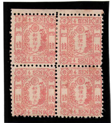
DDO-03 和桜紅4銭6版2-11番 縞 上2枚OH 下2枚NH 未使用 13a ¥110,000