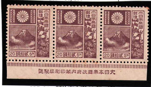
DD7-04 新改富士鹿20銭 NH 銘付 少々 未使用 158 ¥5,500