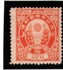
DD6-14 新小判黄橙20銭 OH P13 未使用 72 ¥11,000