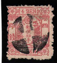
DD5-14 洋桜紅4銭I 外郵白抜十字(YH75I) 微丸 使用済 21a ¥16,500