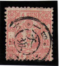
DD5-11 和桜紅4銭II ◎大阪DN 3 B 2 /14.6.10.ち 使用済 13c ¥3,300