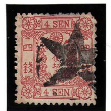
DD5-20 洋桜紅4銭「イ」 外郵★印 (YH75H) 使用済 26 ¥44,000