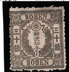
DDO-12 和桜灰30銭「イ」縞OH P11s 未使用 20a ¥440,000