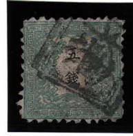
DD5-04 龍5銭10番 □検 ペルア一紙 使用済 8c ¥66,000