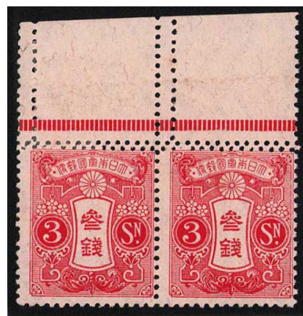
DD8-05 旧大正毛紙3銭横連 最上部二重目打エラー 左切手目打補強 右切手NH 未使用 111 ¥11,000