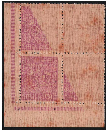
DD8-02 第2次新昭和凸10円田型 NH 一部裏写り 少バ 未使用 261 ¥8,800