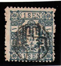
DD5-16 洋桜青1銭「ニ」 ○篆書不統一印 使用済 24d ¥8,800