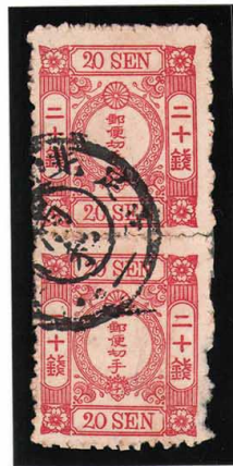
DD3-08 洋改桜紅 20 銭「チ」 浦和 KG 右下小ウスル 再接 使用済 39 ¥3,300