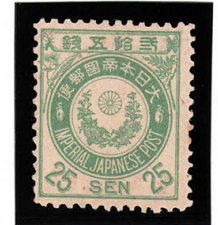
DD6-15 新小判25銭 OH P12 未使用 73 ¥16,500