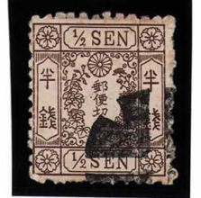
DD5-15 洋桜茶半銭「イ」 外郵クロスロード 使用済 23a ¥11,000