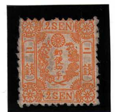
DDO-10 和桜黄2銭 縞 OH 2字異形版 未使用 12c ¥121,000