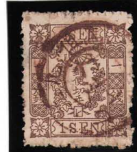
DD5-24 洋改桜茶1銭「レ」 ◎竹濱KG但馬 茶印 P微丸 使用済 35i ¥11,000