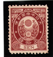
DD6-17 新小判50銭 OH P12 未使用 74 ¥11,000