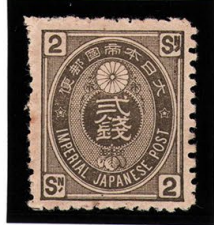
DD6-02 旧小判才2銭 OH 無地11s×12 小ウツ 未使用 49 ¥8,800