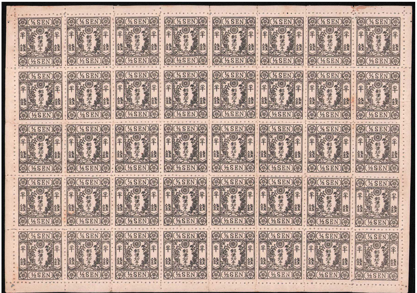
DD1-02 洋桜改色半銭「口」 未使用シート OH ¥220,000