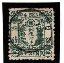
DD5-25 洋改桜緑4銭「イ」 外郵○ (HG76A) 角微丸 使用済 36a ¥8,800