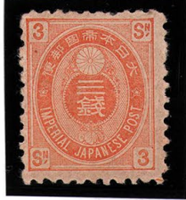
DD6-03 旧小判3銭 OH 木綿10 未使用 51 ¥8,800