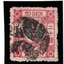
DD5-30 洋改赤20銭「チ」 外郵セリフY 使用済 39a ¥8,800