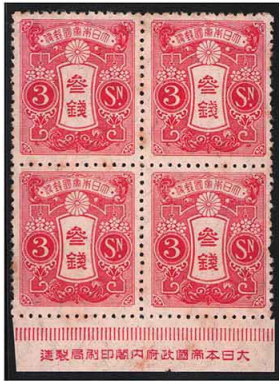
DD7-08 旧大正毛紙3銭 OH ④銘版 霞野 P乱 込 未使用 111 ¥3,300