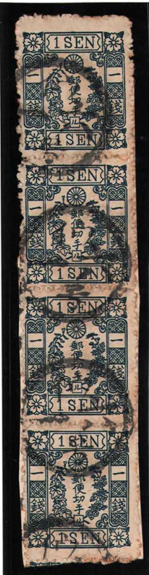
DD3-10 洋桜青 1 銭「ル」 記番イウ 16 号 (肥前長崎) OP 使用済 24k ¥22,000