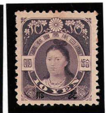
DDO-17 支那字入菊切手高額5円・10円 2種組 OH 未使用 支19・20 ¥253,000