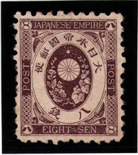
DD6-06 旧小判8銭 NG 木綿10 未使用 55 ¥8,800