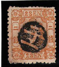
DD5-18 洋桜黄2銭「ホ」 白抜記番子一 使用済 25e ¥5,500