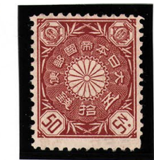
DD6-22 菊切手50銭 OH P12L 未使用 92 ¥11,000