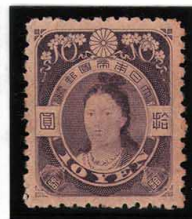
DDO-16 旧大正毛紙高額5円OH・10円NH 2種組 未使用 123・124 ¥176,000