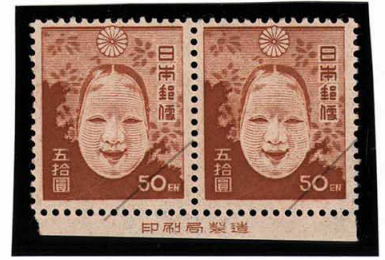
DD7-03 第2次新昭和50円 NH ⑩銘版 耳紙カット 未使用 262 ¥16,500