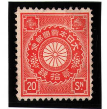
DD6-21 菊切手20銭 OH P12 \frac{1}{2} 未使用 90 ¥5,500