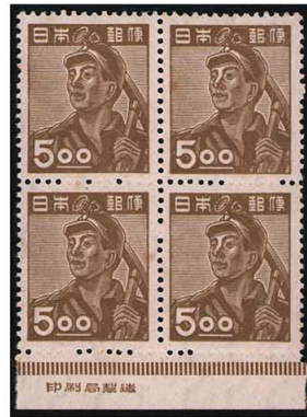
DD7-06 産業図案5円採炭夫 NH ⑩銘版 微々 未使用 284 ¥6,600