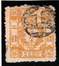
DD5-19 洋桜黄2銭「ム」 白抜記番子一 使用済 25w ¥8,800