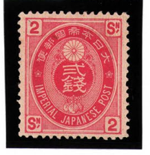
DD6-10 U小判2銭 OH P13 裏小鉛筆 未使用 65 ¥2,200