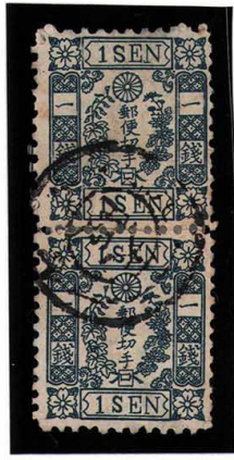
DD3-02 洋桜青 1 銭「ロ」再接 ◎大阪 N.B./7. 11. 17. 夕 使用済 24b ¥5,500