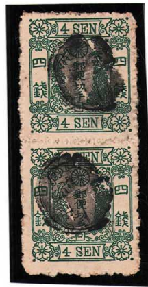
DD3-07 洋改桜緑 4 銭「ロ」 白抜記番印 使用済 36b ¥6,600