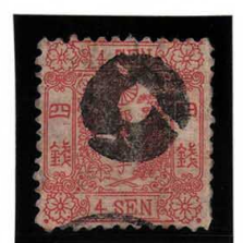
DD5-10 和桜紅4銭8版10番 小ボタ大阪 縞 使用済 13a ¥11,000