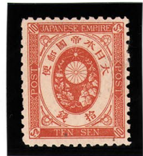
DD6-12 新小判10銭 OH P12 未使用 70 ¥3,300