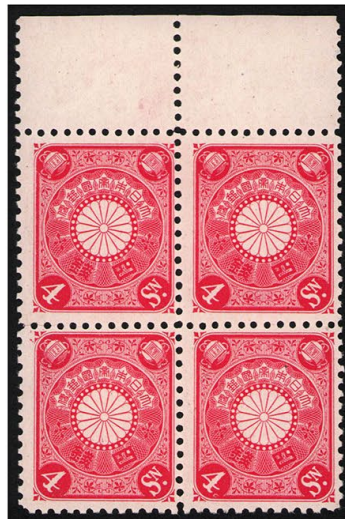
DD6-20 菊切手4銭田型 NH P12L 未使用 84 ¥13,200