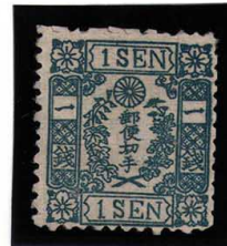
DDO-09 和桜青1銭18版8番 縞 OH 左下PH 未使用 10g ¥88,000