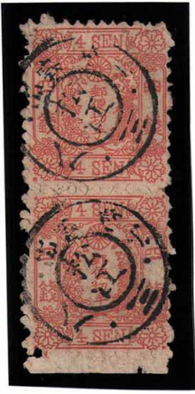
DD3-01 和桜紅 4 銭 9 版 27-35 ◎松江 KG 出雲 使用済 13b ¥22,000