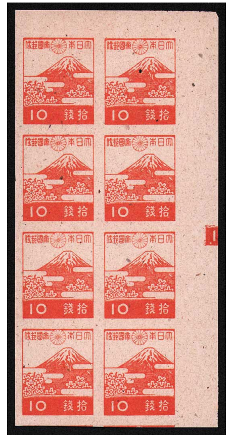
DD8-08 第3次昭和富士山と桜10銭 NH 右マージンにバラ検用目印(10) 粗紙 8枚群 未使用 227 ¥4,400