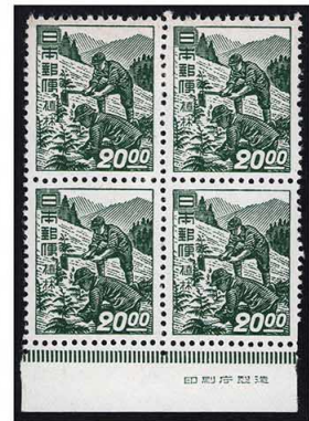
DD7-07 昭和透無20円 NH ⑫銘版 未使用 288 ¥44,000