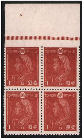
DD8-01 第2次昭和1銭田型 NH 上辺無目打エラー 未使用 205 ¥110,000