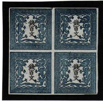
DDO-02 龍100文1版3-12番 縞 NH 未使用 2a ¥209,000