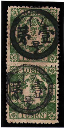
DD3-06 洋桜緑 10 銭「イ」 記番イソ壹号 上切手左目打補修 使用済 28a ¥66,000