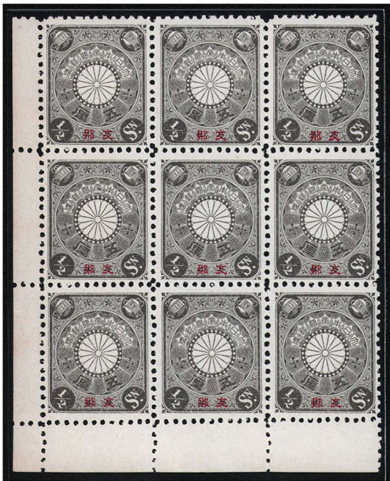
DD6-16 支那覇字入菊切手 \frac{1}{2} 銭9枚群 NH P12L 未使用 支1 ¥11,000