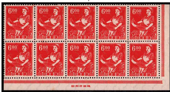
DD7-09 産業図案6円 NH ⑪銘版 櫛型 糊微々 未使用 268 ¥6,600