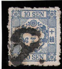
DD5-29 洋改桜群青10銭「ホ」 外郵ボジY (YH77A) P9s×11s 使用済 38b ¥33,000