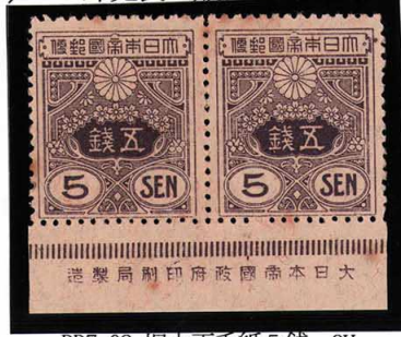
DD7-02 旧大正毛紙5銭 OH ③銘版 茶星 未使用 111 ¥3,300