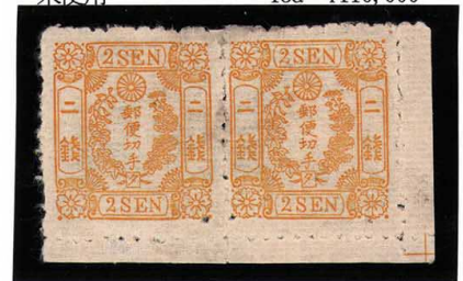
DDO-06 和桜黄2銭「夕」39-40番 縞 OH (39番)PHタイプD 名鑑採録品 未使用 17c ¥143,000