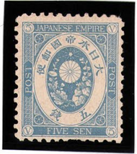
DD6-11 U小判5銭 OH P12 未使用 68 ¥3,300