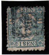
DD5-08 和桜青1銭3版15番 □検 政府 縞 使用済 10g ¥11,000