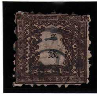
DD5-03 龍半銭2版5番縞 ◎神戸N 1 B 1 /6.11.夕 使用済 5d ¥22,000