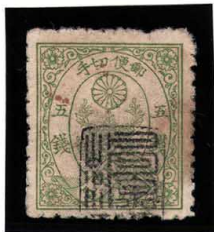
DDO-15 ネギ緑5銭 少 石見浅利不統一印 確認数点 使用済 45 ¥143,000