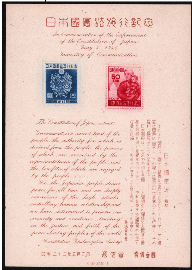
DD8-07 日本国憲法 S/S OH 印刷ずれエラー 未使用 記104 ¥3,300