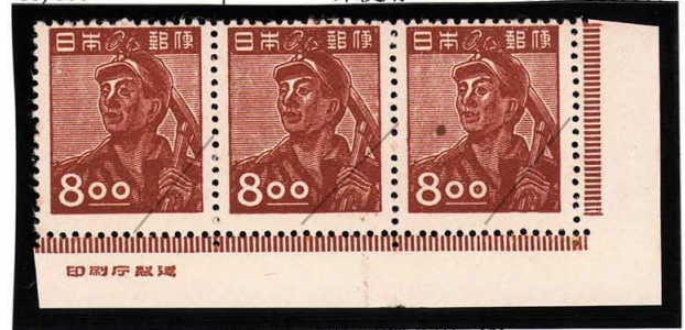
DD7-05 昭和透無8円 NH ⑩銘版 未使用 284 ¥11,000