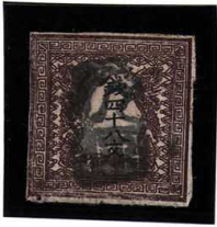
DD5-01 龍48文2版33番縞 □不統一印 使用済 1c ¥22,000