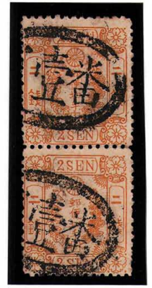
DD3-05 洋桜黄 2 銭「チ」 記番イ壹番 (武蔵東京) 使用済 25h ¥5,500