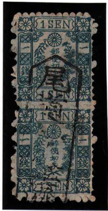
DDO-01 和桜青1銭8版11-19番 □尾道検査済 サドルペア 縞 使用済 10g ¥220,000