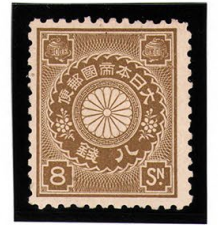
DD6-19 菊切手8銭 OH P12L 未使用 87 ¥5,500