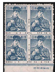
DD7-12 産業図案30円 上1枚OH ⑩銘版 未使用 273 ¥19,800