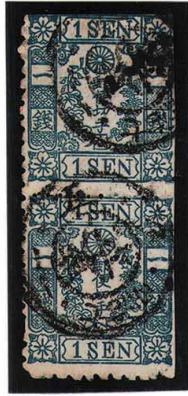
DD3-03 洋桜青 1 銭「へ」8-16 番 右中七宝軽罫エラー 注：使用済 24f ¥6,600