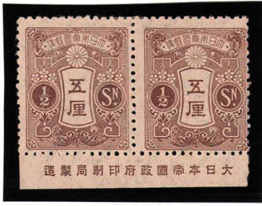
DD7-01 旧大正毛紙5厘 OH ③銘版 白耳 未使用 107 ¥6,600