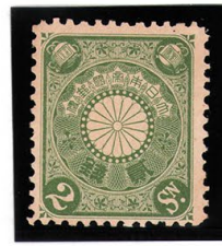
DD6-18 菊切手2銭 NH P12L 未使用 81 ¥3,300