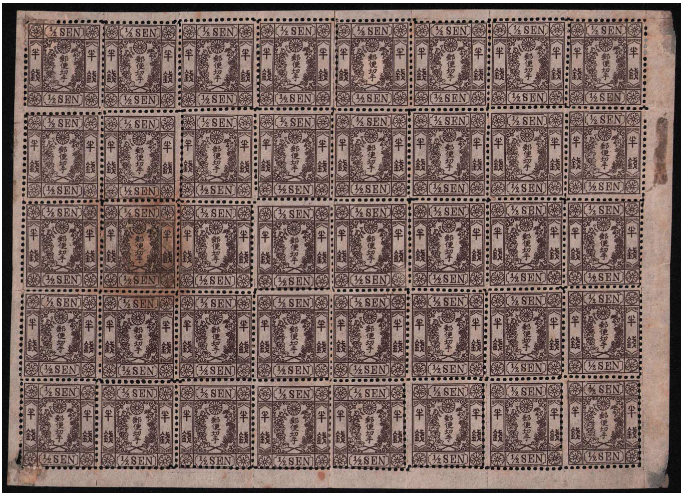
DD2-02 和桜茶半銭3版 未使用シート OH 一部シミ有 ¥99,000