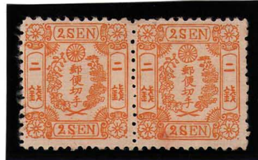
DDO-05 和桜黄2銭II 2種版 縞 OH 極小星有 未使用 12a ¥220,000