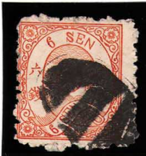
DD5-27 洋改桜橙6銭「カ」 大ボタ新潟 使用済 37d ¥5,500