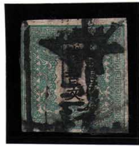
DD5-02 龍500文1版4番縞 □三島検査済印 使用済 4a ¥44,000