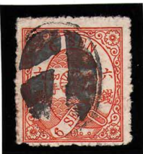
DD5-26 洋改桜橙6銭「子」 大ボタ金沢 使用済 36i ¥5,500