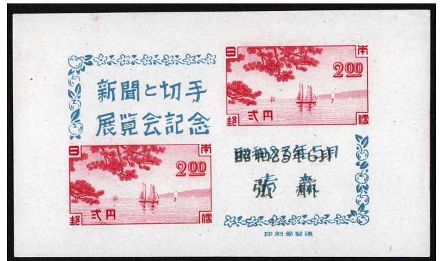
DD8-06 青森切手展S/S 「弘前」加刷 未使用 記125 ¥11,000