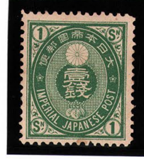
DD6-09 U小判1銭 OH P13 未使用 64 ¥2,200