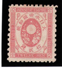
DD6-07 旧小判12銭 NG E紙11×10 未使用 57 ¥27,500