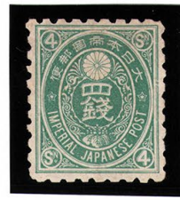
DD6-04 旧小判4銭 NG 藁8% 微カス 未使用 52 ¥3,300