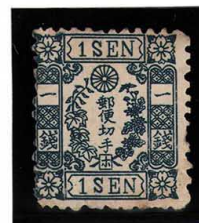
DDO-13 洋桜青1銭「ホ」 OH 未使用 24e ¥55,000