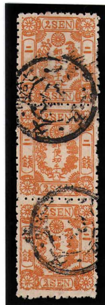
DD3-12 洋桜黄 2 銭「ハ」 ◎西京 N.B./7. 8. 15 使用済 25c ¥19,800