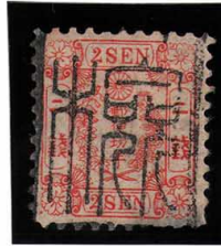
DD5-09 和桜朱2銭2版6番 □(静岡検査済) 松田 MLL 使用済 11a ¥16,500