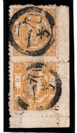
DD3-09 房桜黄 2 銭 記番ニ 19 号 (常陸水戸) 使用済 44 ¥6,600