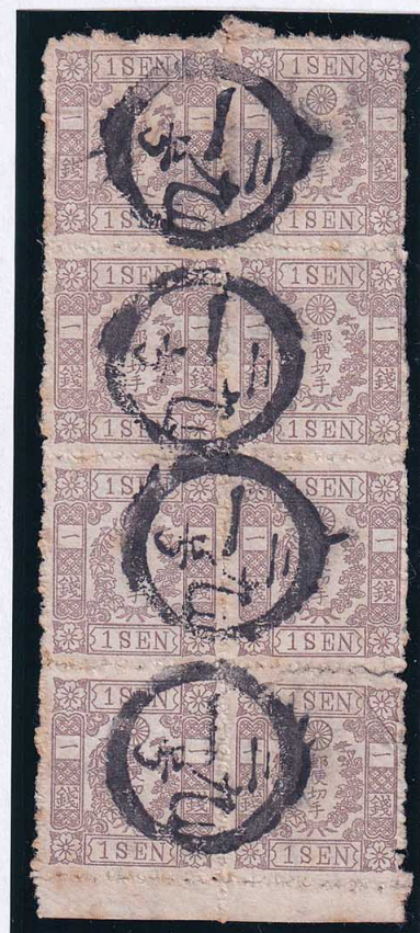
54-10 房桜茶 1 銭 1 版 14~39 番 8 枚群 記番ニ 19 号 (常陸水戸) 使用済 4i ¥132,000