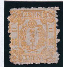
55-29 和桜黄2銭II 縞 NG 未使用 12a ¥165,000