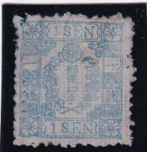
55-21 和桜青1銭21版34番 左辺縦二重目打 少ソ 縞 使用済 10g ¥8,800