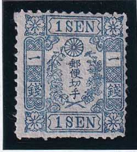
55-07 和桜青1銭I版9番無 松田印刷 NG 未使用 10g ¥9,900