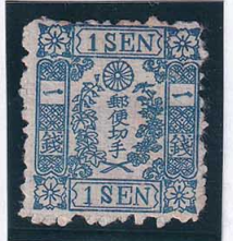
55-11 和桜青1銭12版5番縞 OH 未使用 10g ¥6,600