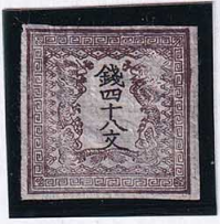
55-01 龍48文1版24番 縞 後期印刷 未使用 1a ¥44,000