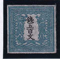
55-04 龍500文1版35番縞 未使用 4a ¥110,000