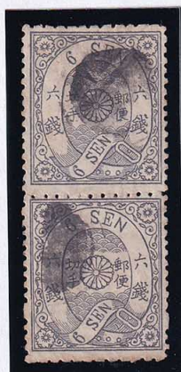
54-03 洋桜墨 6 銭「レ」 つぶれ印 使用済 27g ¥22,000