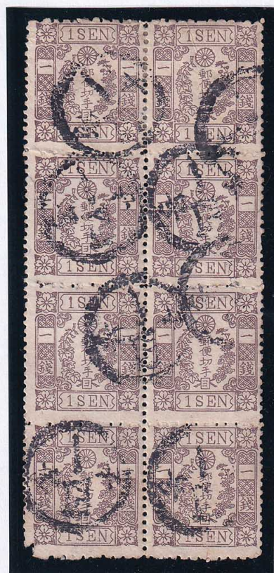
54-09 洋改茶 1 銭「ヨ」 8 枚群 記番子 14 号 (摂津神戸) 左下ピンホール 使用済 35g ¥275,000