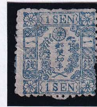
55-13 和桜青1銭16版40番 NG 縞 未使用 10g ¥2,200