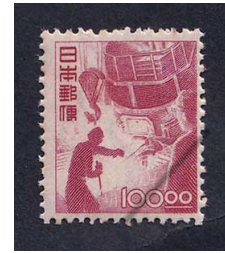
52-02 産業図案 100円 NH 糊少々 未使用 274 ¥28,800