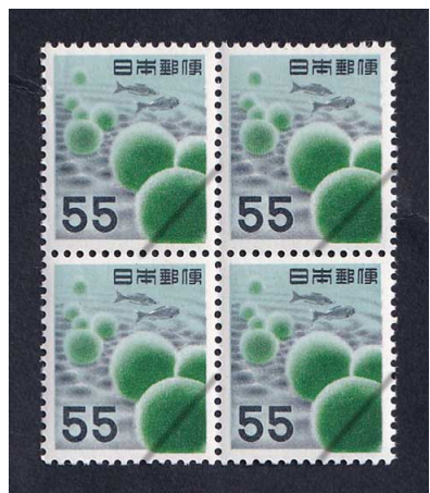
52-05 第1次円単位 55円 NH 田型 未使用 308 ¥4,600