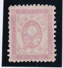
56-15 旧小判鈍桃12銭 NG