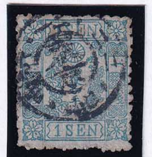
55-16 和桜青1銭1版15番縞 ◎東京N1B1/6.12.22.日中 使用済 政府 10g ¥5,500