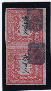
54-01 龍 200 文 1 版 32-40 番 ■潰印 最初期印刷 縞 使用済 3b ¥88,000