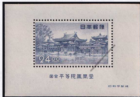
53-08 昭和透無24円 S/S NH 糊小 未使用 289a ¥3,300