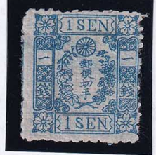
55-10 和桜青1銭10版15番 右下桜重弁落エター OH 縞 未使用 10b ¥33,000