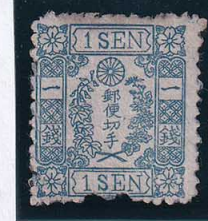
55-14 和桜青1銭21版22番 OH 縞 未使用 10g ¥3,300