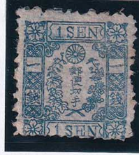
55-08 和桜青1銭5版9番無 OH 未使用 10g ¥3,300