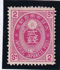
56-22 U小判赤2銭 LH