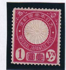
56-30 新小判1円 OH