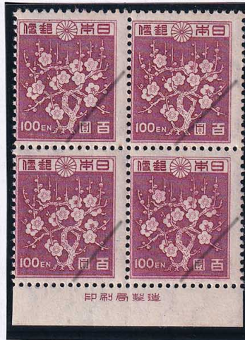
53-05 2次新昭和100円 NH 未使用 263 ¥66,000