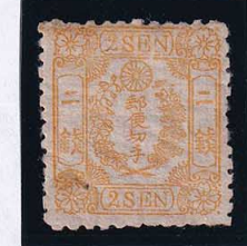
55-30 和桜黄2銭7版8番縞 9点版 左下PH 未使用 12c ¥33,000