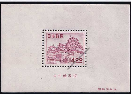
53-07 昭和透無14円 S/S NH 未使用 287a ¥6,600