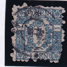
55-25 和桜青1銭26版12番 ◎神戸N1B1/7.6.28.日中 縞 使用済 10g ¥5,500