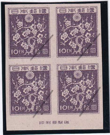
53-01 1次新昭和10円 NH 未使用 245 ¥24,200