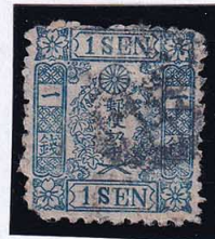
55-17 和桜青1銭3版8番縞 左下桜芯1個落 □検 少ソル 使用済 政府 10g ¥16,500