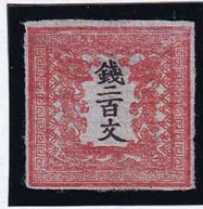
55-03 龍200文1版27番縞 未使用 3a ¥55,000