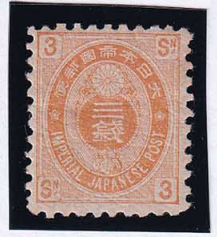
56-05 旧小判3銭 OH