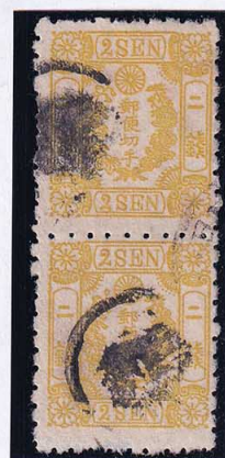
54-05 房桜黄 2 銭 四周目打 9s 使用済 44 ¥55,000