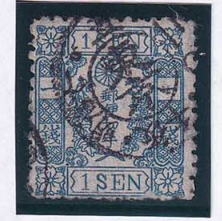
55-20 和桜青1銭21版14番 ◎東京 縞 使用済 10g ¥2,200