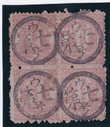
54-06 和桜紅 4 銭 11 版 14・15・22・23 番 記番ウ 7 号 (下諏訪信濃) 使用済