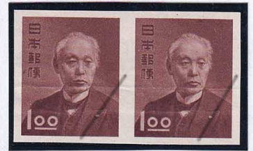
53-06 昭和透無1円 無目打プルーフ 折筋有 未使用 (278) ¥88,000