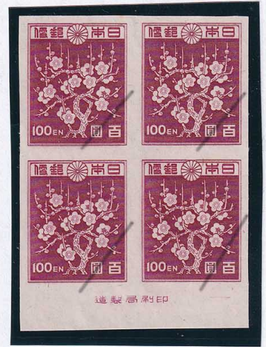
53-03 1次新昭和100円 NH 未使用 247 ¥66,000