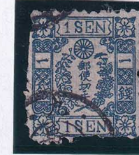
55-23 和桜青1銭23版27番 縞 使用済 10g ¥2,200