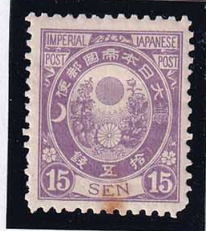
56-26 新小判青紫15銭 OH