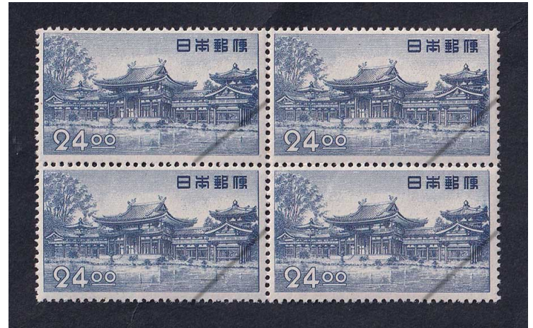
52-04 昭和透無 24円 NH 田型 未使用 289 ¥11,500