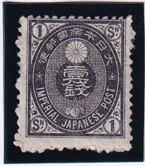
56-01 旧小判黒1銭 OH