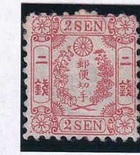
55-28 和桜朱2銭2版32番 MLL NG 未使用 11v ¥77,000