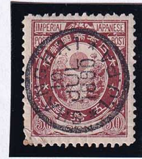
56-29 新小判50銭 補修