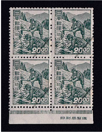
52-01 産業図案 20円 NH ⑩銘田型 糊微々 未使用 272 ¥9,200