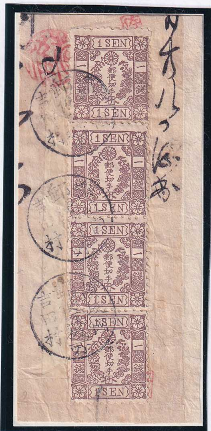
54-08 洋改茶 1 銭「チ」 ○讃岐國吉田村郵便取扱所 紙付 使用済 35c ¥440,000