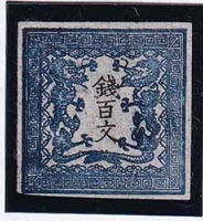
55-02 龍100文1版25番縞 未使用 2a ¥44,000