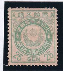
56-28 新小判青緑25銭 OH