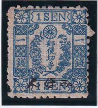
55-06 和桜青1銭III 縞 OH みほん 見本 10g ¥15,400