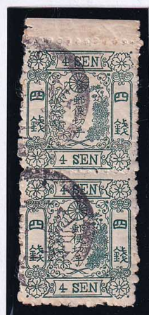
54-04 洋改桜緑 4 銭 II ○ニ壹号 (常陸下館) 使用済 42b ¥22,000