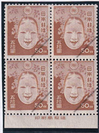
53-04 2次新昭和50円 NH 糊小 未使用 262 ¥38,500