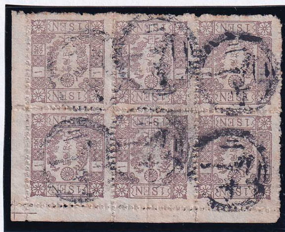
54-07 洋改茶 1 銭「レ」 6~19 番 6 枚群 記番ニ 19 号 (常陸水戸) 使用済