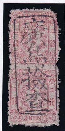
54-02 和桜赤 2 銭 2 版 8-16 番 □廣島検査 政府 無 使用済 11c ¥16,500