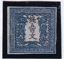
55-05 龍500文2版25番縞 未使用 4g ¥110,000