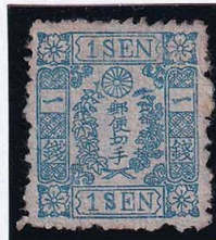
55-12 和桜青1銭12版15番 右上枠軽脚エター 古色 OH 縞 未使用 10f ¥9,900