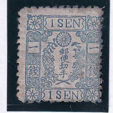
55-15 和桜青1銭24版38番 NH 縞 未使用 10g ¥4,400