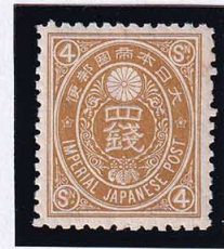
56-24 新小判才4銭 NH