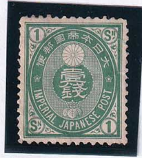
56-21 U小判緑1銭 OH