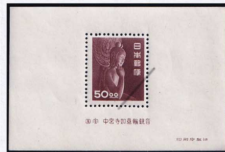
53-09 昭和透無50円 S/S NH 未使用 291a ¥33,000