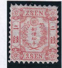
55-27 和桜朱2銭1版7番 MLL NG 未使用 11v ¥66,000