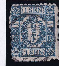
55-18 和桜青1銭6版11番縞 ◎大阪N1B1/7.3.26 使用済 10g ¥5,500