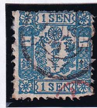
55-22 和桜青1銭22版3番 ◎西京N1B1 使用済 10g ¥8,800