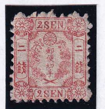
55-26 和桜朱2銭 無 OH MLL 未使用 11v ¥55,000