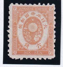
56-10 旧小判鈍橙6銭 NG