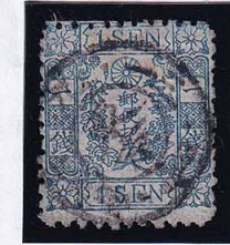
55-24 和桜青1銭24版2番 ◎東京N1B1/6.9.15.日中 縞 使用済 10g ¥5,500