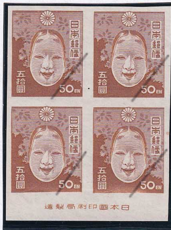
53-02 1次新昭和50円 NH 未使用 246a ¥44,000