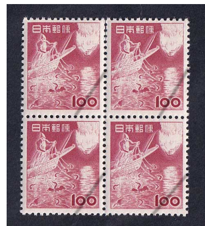
52-06 第1次円単位 100円 NH 田型 未使用 310 ¥13,800