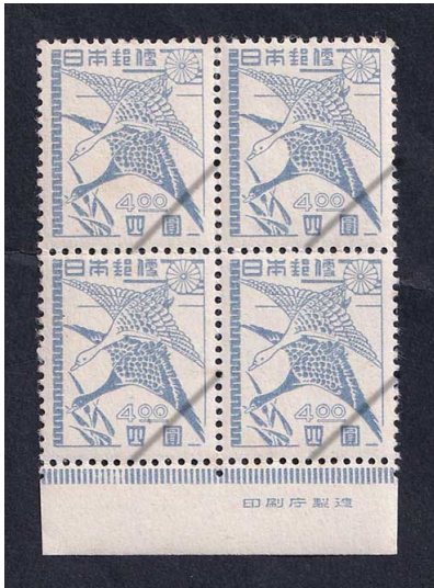
52-03 昭和透無 4円 NH ⑩銘田型 糊微々 未使用 281 ¥5,800