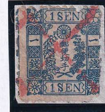
55-19 和桜青1銭14版2番縞 右上桜花弁全芯落エター 紙付 注：使用済 10f ¥44,000