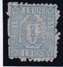
55-09 和桜青1銭8A版2番無 NG 未使用 10g ¥198,000