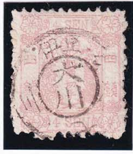
42-02 和桜紅4銭 I 縞 ◎大川KG伊豆 使用済 13a ¥22,000