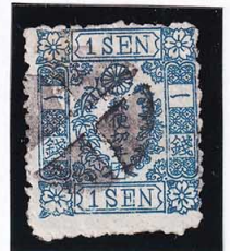
42-18 洋桜青1銭「チ」 外郵白抜十字 (YH75A) 使用済 24h ¥13,200