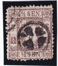
41-22 和桜茶 半 銭 3 版 10 番 縞 白抜十字 使用済 9d ¥3,300