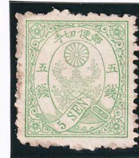
43-29 ネギ緑 5 銭 NG 未使用 45 ¥33,000