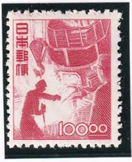
45-01 産業図案 100円 NH