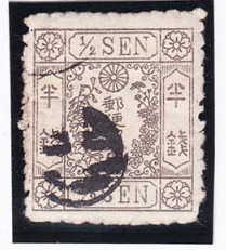
43-10 洋改桜灰半銭「ハ」 白抜十字 使用済 34b ¥2,200