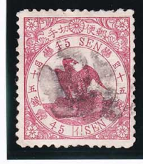
43-08 鳥紅 45 銭「イ」 外郵青色複十字印 使用済 33a ¥19,800