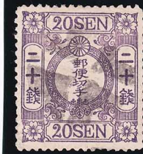
42-29 洋桜紫20銭「ニ」 外郵ククロスロード 使用済 29a ¥13,200