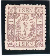
43-11 洋改桜茶 1 銭「カ」OH 未使用 35f ¥8,800