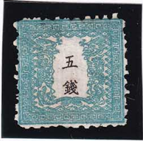
41-20 龍 五 銭 1 番 縞 未使用 8d ¥110,000