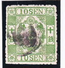
42-27 洋桜緑10銭「ロ」 使用済 28b ¥6,600