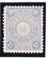
44-21 菊青1½銭 OH P12½ 未使用 79 ¥5,500