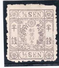
43-09 洋改桜灰半銭「口」NG 未使用 34a ¥2,640