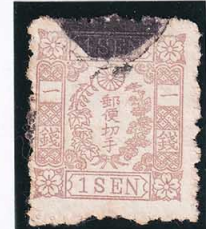
43-26 房桜茶 1 銭 右中七宝小欠エー 使用済 43 ¥3,300