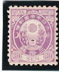
44-15 旧小判紫30銭 墨点 見本 60 ¥13,200