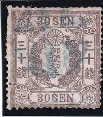
42-08 和桜灰30銭 無 外郵青色複十字印 使用済 16 ¥55,000