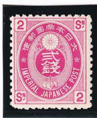
44-18 U小判赤2銭 OH 未使用 65 ¥4,400