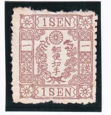
43-25 房桜茶 1 銭 NG 未使用 43 ¥5,500