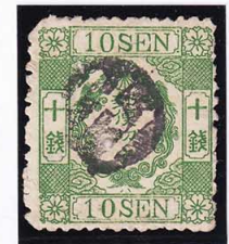
42-28 洋桜緑10銭「ハ」 白抜き一 極小穴 使用済 28c ¥17,600