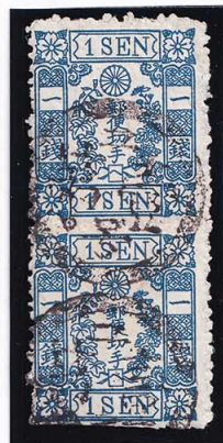
40-08 洋桜青1銭「へ」 菊紋章重弁全落 使用済 24f ¥44,000