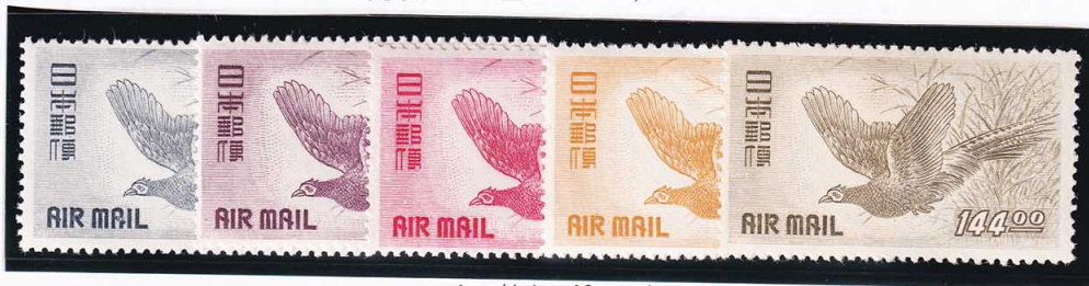
45-09 きじ航空 5種セット OH