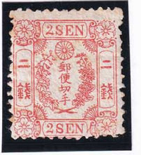
41-25 和桜朱 2 銭 無 未使用 11a ¥30,800