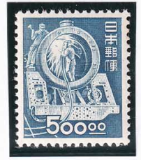
45-04 昭和透無 500円 NH