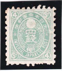
44-07 旧小判4銭 OH 未使用 52 ¥5,500