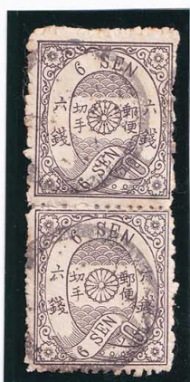
40-11 洋桜墨6銭「ソ」 記番印 小竹 使用済 27h ¥55,000