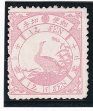
43-03 鳥桃 12 銭「イ」 NG 針頭大ウシ 未使用 31a ¥33,000