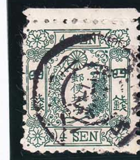
43-24 洋改緑 4 銭 13 版 6 番 ◎名古屋 KG 尾張 使用済 42b ¥16,500