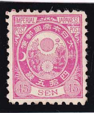
44-16 旧小判鈍紅45銭 OH 無地紙 未使用 61 ¥121,000