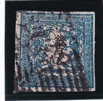
41-10 龍 100 文 2 版 1 番 縞 使用済 2c ¥60,500