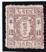
41-21 和桜茶 半 銭 III 縞 政府印刷 OH 未使用 9d ¥11,000