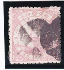
43-04 鳥桃 12 銭「イ」21 番 右上隅が 代落エー 使用済 31a ¥22,000