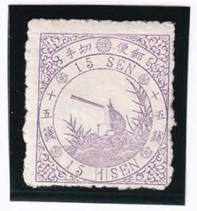
43-05 鳥紫 15 銭「イ」 NH 未使用 32a ¥33,000