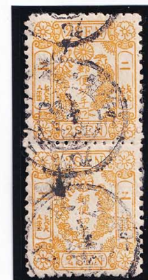
40-10 洋桜黄2銭「ワ」 ◎横浜N1B1 小エラ有 使用済 25m ¥19,800