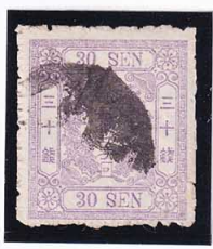
43-22 洋改桜紫 30 銭「口」 使用済 40a ¥8,800