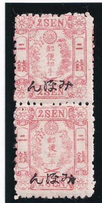
40-04 和桜赤2銭 縞 みほん 見本 11b ¥26,400