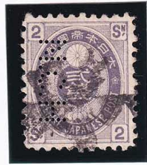
44-05 旧小判紫2銭 穿孔NCH 使用済 50 ¥22,000