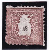
41-17 龍 半 銭 2 版 31 番 縞 赤褐色 未使用 5d ¥15,400