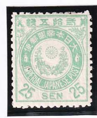
44-20 新小判淡青緑25銭OH 未使用 73 ¥28,600