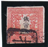
41-14 龍 200 文 2 版 9 番 縞 口検 使用済 3c ¥176,000