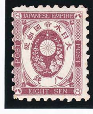
44-10 旧小判茶8銭 OH 未使用 55 ¥8,800