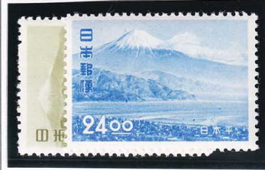
45-07 観光地百選日本平2種セット OH