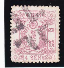
42-14 洋桜紅4銭「ツ」 I 外郵ククロスロード 使用済 21a ¥27,500