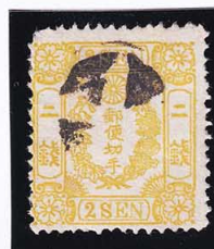
43-27 房桜黄 2 銭 白抜十字 使用済 44 ¥2,200