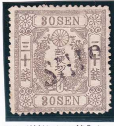
43-02 洋桜灰 30 銭「イ」 SHIP 使用済 30 ¥15,400