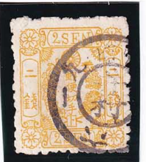
42-21 洋桜黄2銭「ト」 ◎井村KG備中 使用済 25g ¥37,400