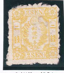
42-09 和桜黄2銭「夕」 縞 RC ウスル 未使用 17c ¥8,800