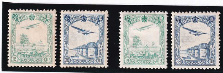
45-11 満州航空切手 第1次・2次4種セット OH