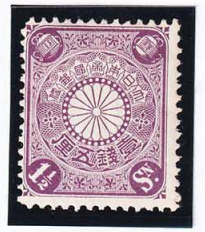
44-22 菊紫1½銭 OH P12½ 未使用 80 ¥8,800