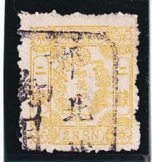
42-22 洋桜黄2銭「ム」 □北越/(郵便御用) 使用済 25w ¥27,500