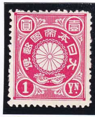
44-30 菊1円 NH P12½ 未使用 93 ¥44,000