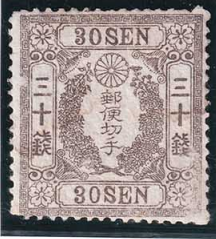
42-07 和桜灰30銭 無 OH 未使用 16 ¥66,000