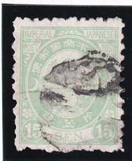
44-13 旧小判15銭 外郵Y E紙11×10 使用済 58 ¥13,200