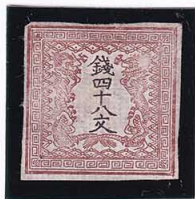
41-06 龍 48 文 1 版 26 番 縞 初期印刷 極小ウシ 未使用 1a ¥24,200