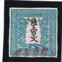
41-15 龍 500 文 1 版 12 番 縞 東京ボタ贈呈消 見本 4a ¥132,000