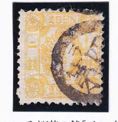
42-10 和桜黄2銭「イ」 縞 記番ヲ4号 (美濃・加納) 使用済 17a ¥55,000