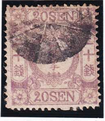
42-06 和桜紫20銭 無 外郵大型8花黒印 使用済 15a ¥50,600