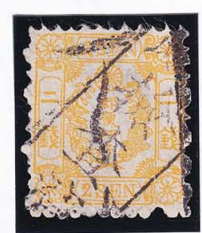
41-30 和桜黄 2 銭 III 縞 口(奈良)検査済 使用済 12c ¥5,500