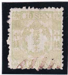
41-01 和桜黄緑 10 銭 縞 大ボタ贈呈消 政府 見本 14b ¥110,000