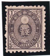
44-02 旧小判黒1銭 OH 無地 未使用 47 ¥7,700