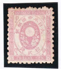
44-12 旧小判桃12銭 OH 古色 未使用 57 ¥13,200