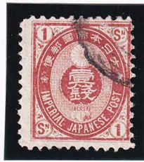
44-03 旧小判茶1銭 木綿紙 P11L 使用済 48 ¥11,000