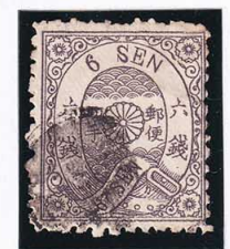
42-26 洋桜墨6銭「カ」 つぶれ印 使用済 27d ¥22,000