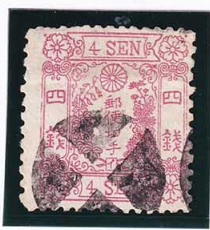
42-24 洋桜紅4銭「イ」 2版12番 白抜十字 使用済 26 ¥66,000