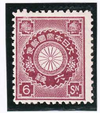
44-24 菊栗6銭 OH 未使用 86 ¥6,600