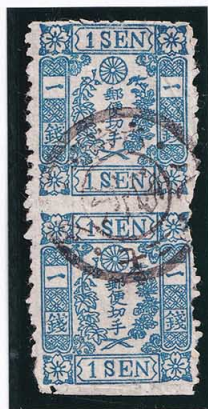
40-03 和桜青1銭12版5・13番 ◎西京/6.8.27 使用済 10g ¥13,200