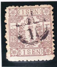
43-12 洋改桜茶 1 銭「カ」 クツワ十字 使用済 35f ¥3,300