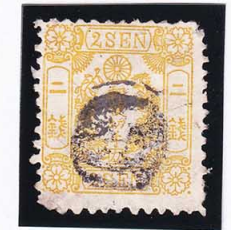
42-20 洋桜黄2銭「カ」 白抜記番イケー (渡島・函館) 使用済 25n ¥16,500