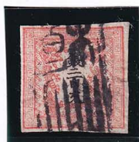
41-12 龍 200 文 1 版 15 番 縞 使用済 3a ¥44,000