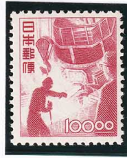
45-03 昭和透無 100円 NH