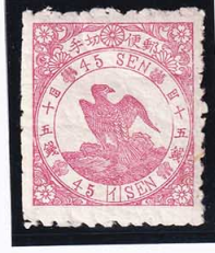
43-07 鳥紅 45 銭「イ」 OH 裏小黒紙跡有 未使用 33a ¥66,000