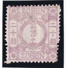
42-05 和桜紫20銭 無 OH 未使用 15a ¥66,000