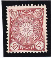
44-29 菊茶50銭 OH 未使用 92 ¥22,000