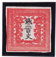
41-11 龍 200 文 1 版 5 番 縞 濃朱色 未使用 3a ¥50,600