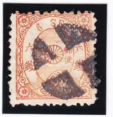
43-15 洋改桜橙 6 銭「ヌ」 外郵白抜十字 使用済 37a ¥8,800