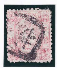
41-28 和桜赤 2 銭 縞 口検 使用済 11b ¥4,400