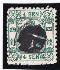
43-23 洋改緑 4 銭 14 版 28 番 白抜記番イ一 使用済 42b ¥16,500