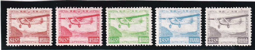
45-08 芦ノ湖航空 5種セット OH