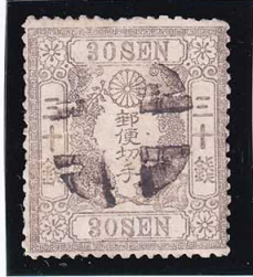
41-02 洋桜灰グツ 30 銭 外郵白抜十字 Pos20 使用済 22 ¥550,000