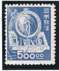
45-02 産業図案 500円 NH