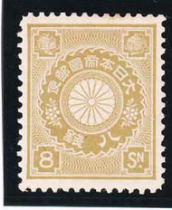
44-25 菊才8銭 OH P12½ 未使用 87 ¥13,200