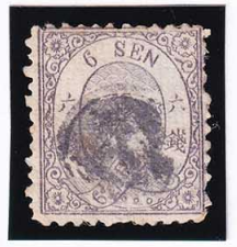
42-12 和桜墨6銭「リ」 縞 使用済 18i ¥66,000