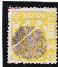
43-28 房桜黄 2 銭 つぶれ印 使用済 44 ¥2,200