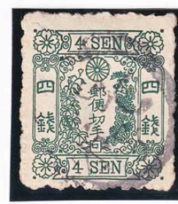
43-14 洋改桜緑 4 銭「口」 記番ヤ 7 号 使用済 36b ¥4,400