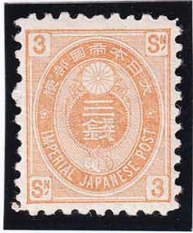
44-06 旧小判橙3銭 OH 裏小紙付 未使用 51 ¥11,000