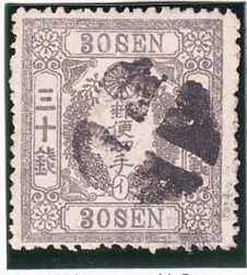
43-01 洋桜灰 30 銭「イ」 白抜十字 使用済 30 ¥15,400