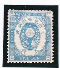
44-19 U小判青5銭 OH 軽札 未使用 68 ¥2,200