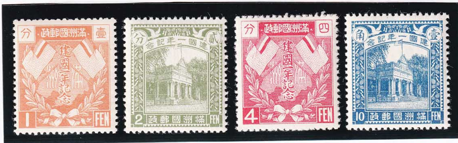
45-10 満州記念切手 建国1年4種セット OH