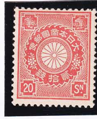
44-28 菊赤橙20銭 OH 未使用 90 ¥8,800