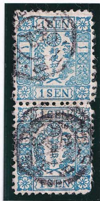
40-02 和桜青1銭7版21・29番 ◎ 使用済 10g ¥77,000