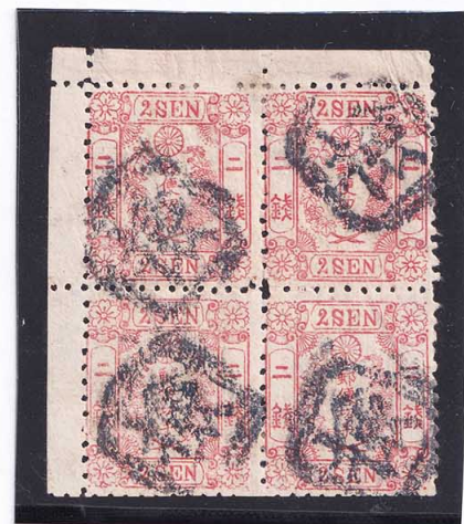
40-13 和桜赤2銭1+2+9+10番 無 口検 政府 使用済 11c ¥198,000