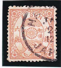
43-16 洋改桜橙 6 銭「子」 ○大型(NAGASAKI) 使用済 37i ¥15,400