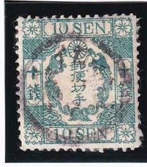
42-03 和桜青緑10銭 無 記番イカ1号 使用済 14a ¥33,000