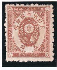
44-08 旧小判茶5銭 OH 未使用 53 ¥11,000