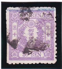
43-21 洋改桜紫 30 銭「ニ」 使用済 40c ¥3,300