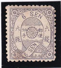
41-03 洋桜墨 6 銭「ヌ」 銭字タキと片波落エー 少シ 未使用 27a ¥132,000