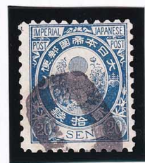
44-14 旧小判20銭 大ボタ大阪 白紙10(藁粒有) 使用済 59 ¥3,300