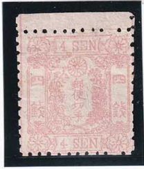
42-01 和桜紅4銭2版2番縞 菊紋章全重弁軽開紅テ NG 未使用 13a ¥66,000