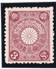
44-23 菊栗3銭 OH P12L 未使用 82 ¥5,500