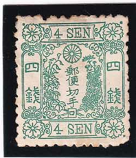
43-13 洋改緑 4 銭「口」 ウシ 未使用 36b ¥6,600