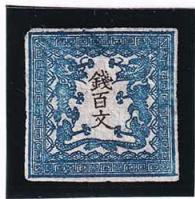
41-07 龍 100 文 1 版 29 番 縞 未使用 2a ¥44,000