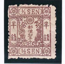
42-15 洋桜茶半銭「イ」 軽ル 未使用 23a ¥3,300