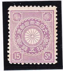
44-27 菊15銭 OH P12 未使用 89 ¥22,000