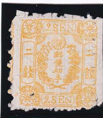
41-29 和桜黄 2 銭 7 版 8 番 縞 NG 未使用 12c ¥33,000