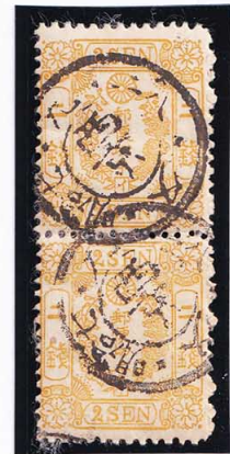
40-09 洋桜黄2銭「イ」 ◎西京N1B1/7.9.28 使用済 25a ¥22,000