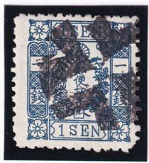
42-19 洋桜青1銭「ル」 外郵ククロスロード 使用済 24k ¥16,500