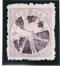
43-06 鳥紫 15 銭「口」 外郵中型 8 花黒印 使用済 32b ¥19,800