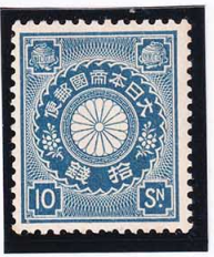
44-26 菊10銭 OH P13×13½ 未使用 88 ¥6,600