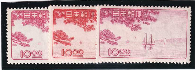
45-05 岡山・松山・高松博覧会 3種セット OH