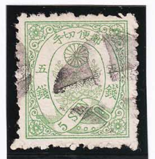
43-30 ネギ緑 5 銭 外郵白抜十字 使用済 45 ¥17,600