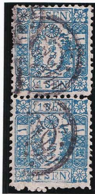
40-01 和桜青1銭6版25・33番 ◎大阪N1B1 使用済 10g ¥26,400