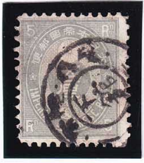
44-01 旧小判5厘 ◎下館KG常陸 使用済 46 ¥3,300