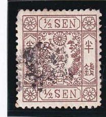
42-16 洋桜茶半銭「ロ」 左上RC 使用済 23b ¥2,860