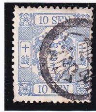
43-18 洋改桜群青 10 銭「ニ」 記番へ 1 号(相模小田原) 使用済 38a ¥5,500