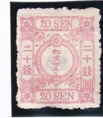
43-19 洋改桜紅 20 銭「チ」NG ウシ 未使用 39 ¥4,400