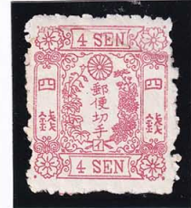
42-23 洋桜紅4銭「イ」 上部補修 NG 未使用 26 ¥55,000