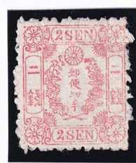
41-27 和桜赤 2 銭 縞 NG 未使用 11b ¥16,500