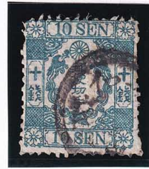
42-04 和桜青緑10銭 無 記番イロ1号 松田 使用済 14a ¥33,000