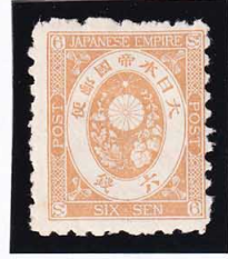
44-09 旧小判橙6銭 OH 未使用 54 ¥26,400