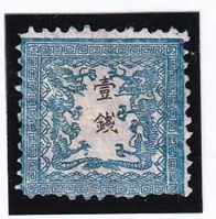
41-18 龍 壹 銭 2 版 27 番 縞 極小補修 未使用 6c ¥36,300