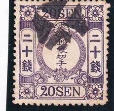
42-30 洋桜紫20銭「ホ」 八角白抜十字 使用済 29b ¥13,200