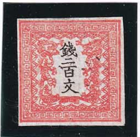
41-13 龍 200 文 2 版 6 番 縞 未使用 3c ¥374,000