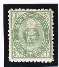
44-17 U小判緑1銭 OH 藁紙 P12 未使用 64 ¥3,300