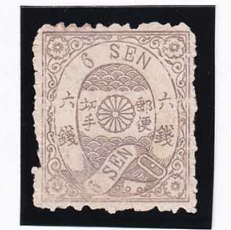
42-25 洋桜墨6銭「夕」 古色 未使用 27f ¥11,000