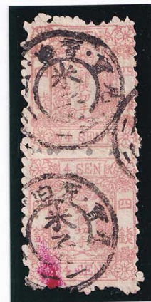
40-05 和桜紅4銭9版7・15番 ◎米子KG 使用済 13a ¥16,500