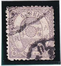
42-11 和桜墨6銭「ホ」 縞 記番イル1号 (安芸・広島) 使用済 18e ¥66,000