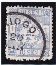
43-17 洋改桜青 10 銭「ニ」 ○大型HIOGO 使用済 38a ¥17,600