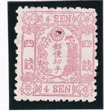
42-13 洋桜紅4銭II14版11番 墨点 見本 21b ¥55,000