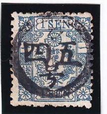
42-17 洋桜青1銭「へ」 記番カ45号 (伊勢・宇治) 使用済 24f ¥5,500