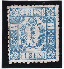
41-23 和桜青 1 銭 25 版 9 番 縞 OH 未使用 10f ¥5,500