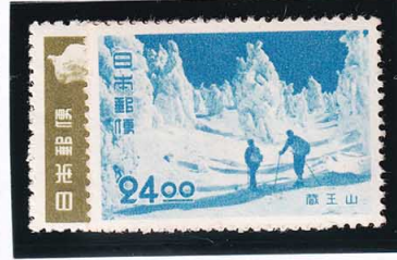
45-06 観光地百選蔵王山2種セット OH