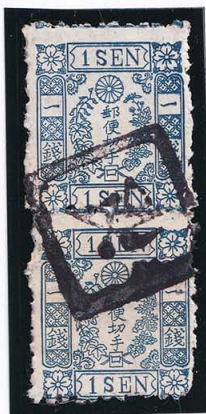
40-06 洋桜青1銭「口」 口弘 (陸奥弘前) 使用済 24b ¥22,000