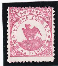
41-04 鳥紅 45 銭「ハ」 NG 裏小印有 未使用 33c ¥132,000