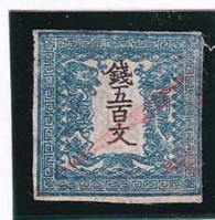
41-16 龍 500 文 2 版 8 番 縞 朱役所印 使用済 4g ¥110,000