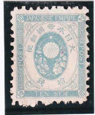
44-11 旧小判青10銭 NG 未使用 56 ¥6,600