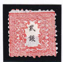
41-19 龍 貳 銭 25 番 縞 小ウシ補修 未使用 7a ¥66,000