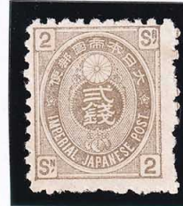
44-04 旧小判才2銭 NG 無地紙 P10 未使用 49 ¥6,600