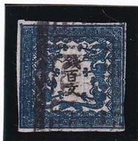
41-08 龍 100 文 1 版 20 番 縞 濃青色 極薄紙 使用済 2a ¥26,400