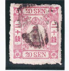
43-20 洋改桜紅 20 銭「チ」 使用済 39 ¥2,200