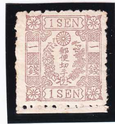
41-05 洋改桜茶 1 銭「ヲ」OH 未使用 35d ¥132,000