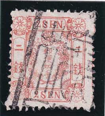
41-26 和桜朱 2 銭 無 使用済 11a ¥13,200