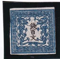
41-09 龍 100 文 2 版 16 番 縞 未使用 2c ¥55,000