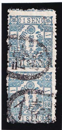
40-07 洋桜青1銭「ニ」 記番イ壹番 使用済 24d ¥11,000