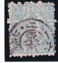
41-24 和桜青 1 銭 8 版 5 番 縞 ◎東京 Ni.B 1 /7. 2. 16 使用済 10g ¥13,200