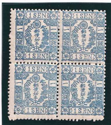
40-12 洋桜青1銭「チ」2版25+34番 上2枚OH跡 下2枚NH 未使用 24h ¥132,000